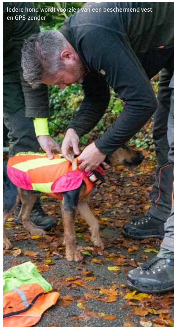
Iedere hond wordt voorzien van een beschermend vest en GPS-zender