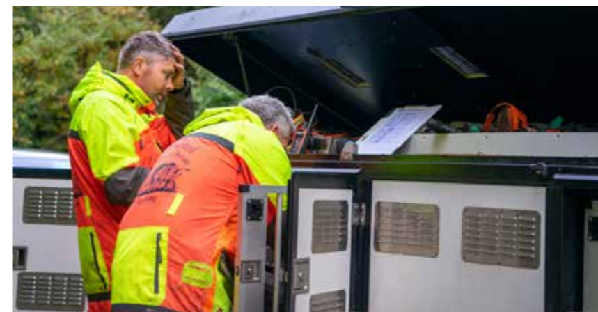
Nog niet alle honden zijn terug bij het vertrekpunt aan het einde van de jacht