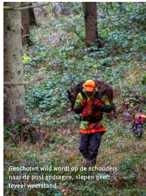
Geschoten wild wordt op de schouders naar de post gedragen, slepen geeft teveel weerstand