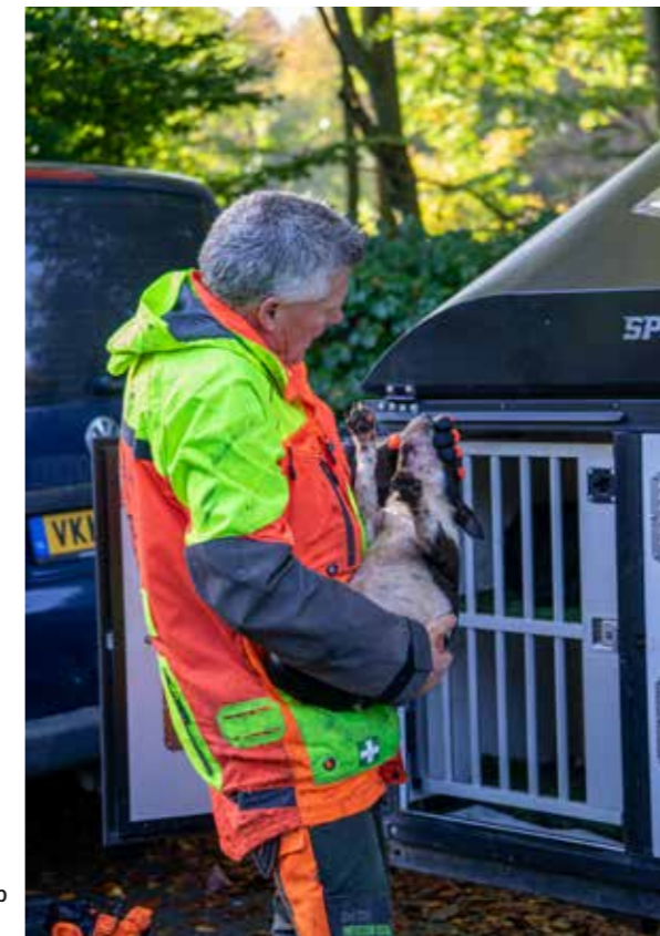
Alle honden worden na afloop grondig gecheckt op eventuele verwondingen