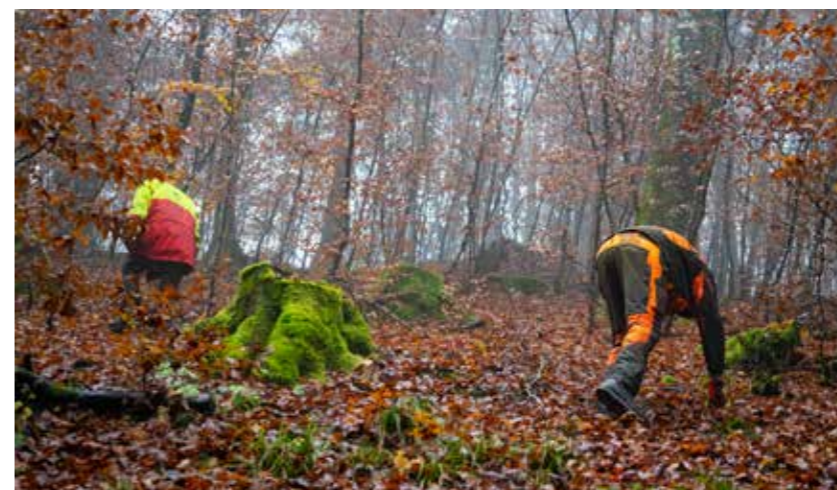
Steile hellingen, glibberige stenen, het is voor de drijvers flink afzien