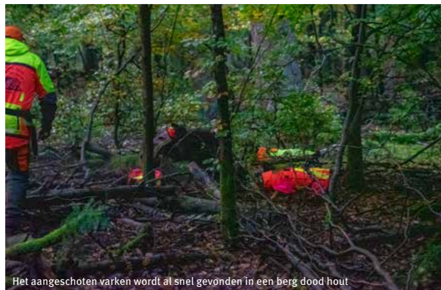
Het aangeschoten varken wordt al snel gevonden in een berg dood hout