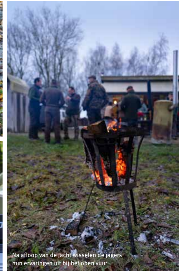
Na afloop van de jacht wisselen de jagers hun ervaringen uit bij het open vuur