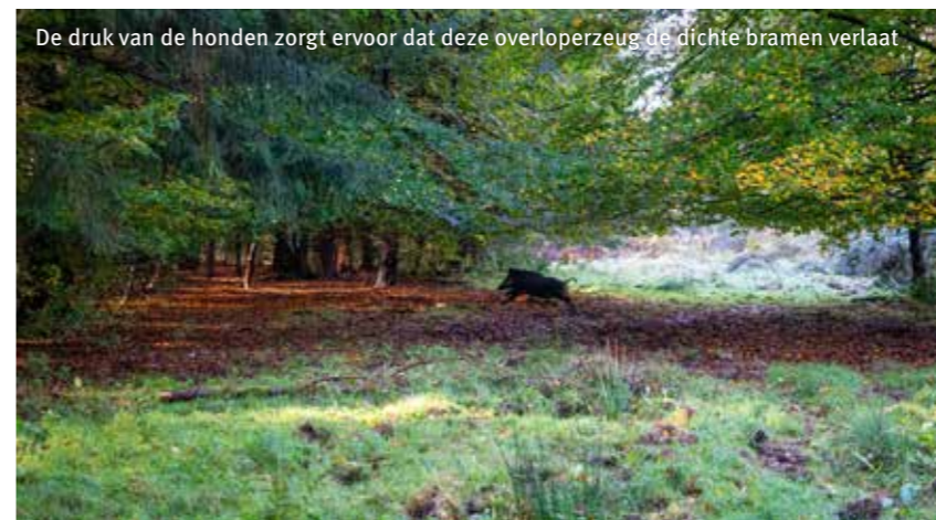
De druk van de honden zorgt ervoor dat deze overloperzeug de dichte bramen verlaat