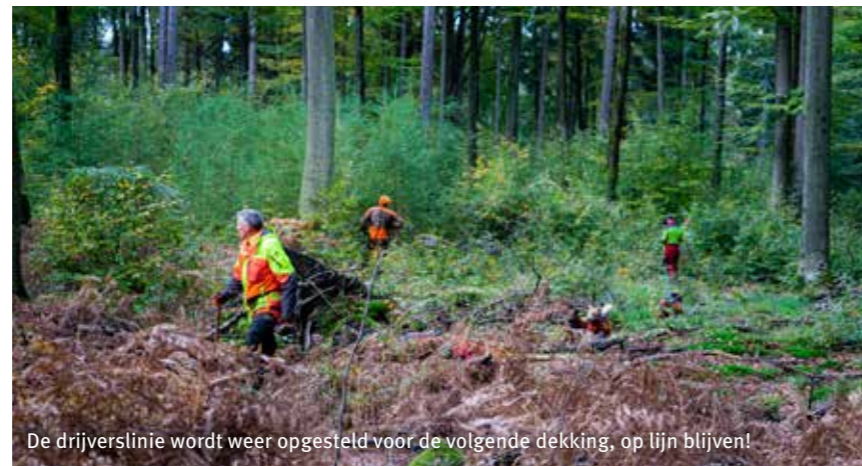
De drijverslinie wordt weer opgesteld voor de volgende dekking, op lijn blijven!