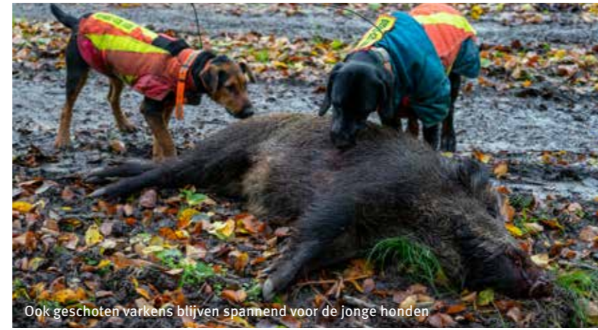
Ook geschoten varkens blijven spannend voor de jonge honden