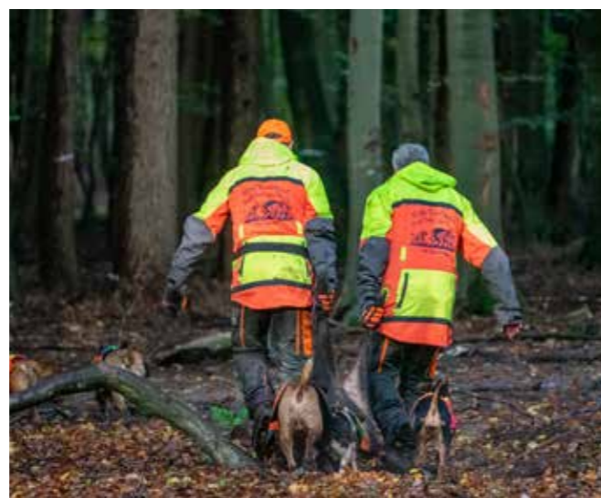
Het varken wordt naar de dichtstbijzijnde weg gesleept om later te worden opgehaald