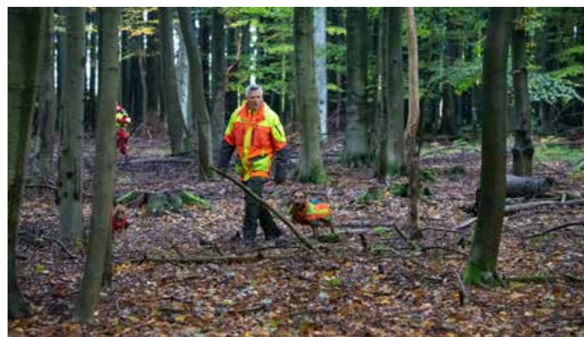
Een gevarieerd terrein, met afwisselend dekking en open bos