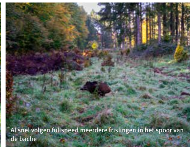
Al snel volgen fullspeed meerdere frislingen in het spoor van de bache